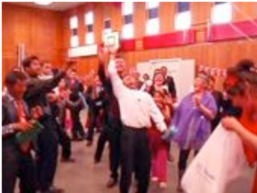
Paggatsitsineq (At kaste ting i grams) i Upernavik.

På baggrund af mit feltarbejde i Upernavik og Kullorsuaq, skal jeg beskrive og analysere brugen af 3 grønlandske skikke, som er følgende: Perusineq (at danse og hoppe af glæde), Paggatsitsineq (at kaste ting i grams) og Ukiutoqqami seqqorneq (at skyde nytåret ind).