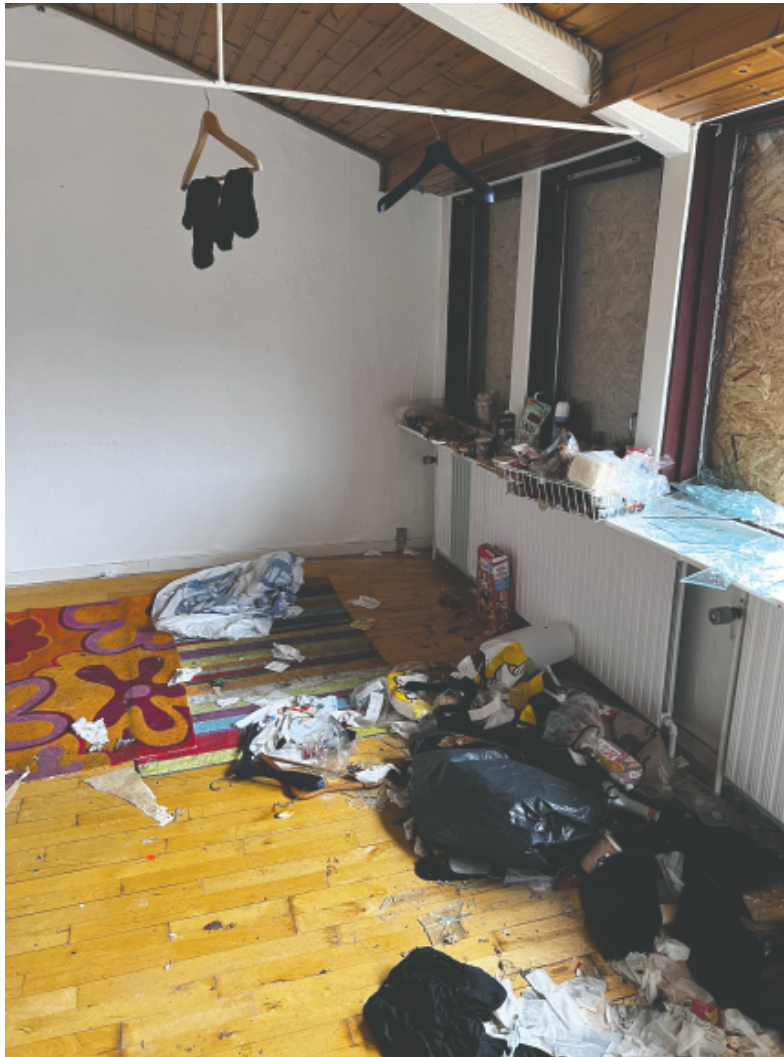
Base i forladt bygning.