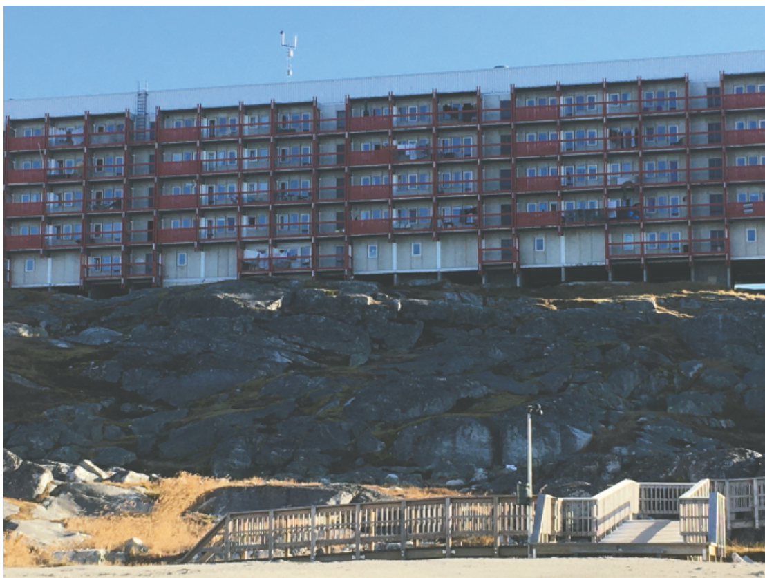
Radiofjeldet, Nuuk.

andre rammer i lokalmiljøet. De situationer og processer, som opsøgende medarbejdere bliver involveret i, er ofte åbne og uforudsigelige af karakter (Andersson, 2013). Med andre ord, så arbejder opsøgende medarbejdere ofte i sammenhænge, der går ud over deres egen kontrol og med uforudsigelige situationer. Derfor er håndtering af krisesituationer og hændelser en central del af arbejdet (ibid). Fundamentet i opsøgende arbejde er at etablere kontakt, igangsætte sociale forandringsprocesser og yde støtte for at vedligeholde kontakten under forandringsprocesser (ibid).