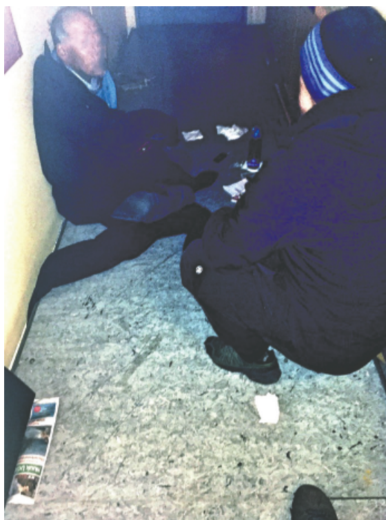
Gademedarbejder og udsat borger (ansigt anonymiseret).

Manden var omgivet af hans få ejendele. Stykker af papir, cigaretskod og resterne af et måltid. Manden må have fornemmet vores tilstedeværelse, for han vågnede og satte sig op og så på os. Han så overrasket ud og virkede konfus. Jeg kan godt forstå hans umiddelbare chok og overraskelse, da han vågnede op til to fremmede, der stod tæt på og kiggede ned på ham. Det næste, der skete var, at den ansatte i gadeteamet interagerede med manden. Han tog et halvt skridt fremad og knælede ned for at være i samme øjenhøjde med manden. Han talte stille og tålmodigt, mens han indtog en passiv position, det vil sige, mens han knælede, var hans hænder åbne og håndfladerne vendte opad. Interaktionen var kort, og varede kun syv minutter. Til slut begyndte manden at pakke sine ting og forlod området. Senere fortalte socialarbejderen mig, at manden